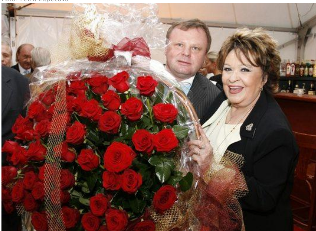
Jiřina Bohdalová oslavila narozeniny ve velkém stylu ■