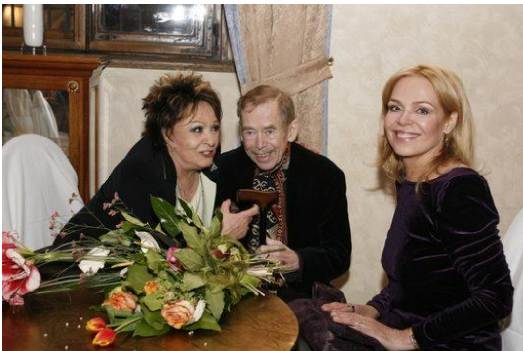
Popřát Bohdalové přišel přes vážný zdravotní stav i exprezident Václav Havel s manželkou Dagmar. ■